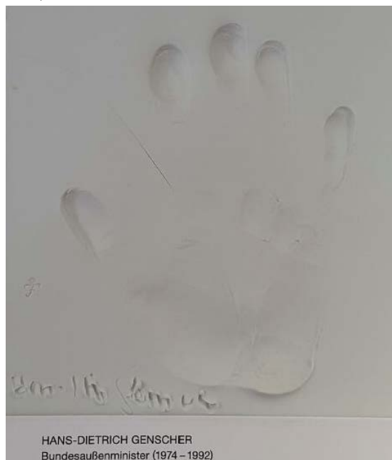
HANS-DIETRICH GENSCHER Bundesaußenminister (1974 – 1992)